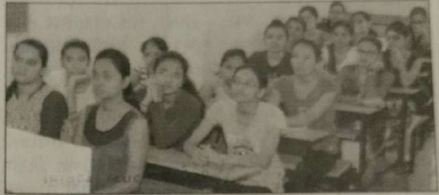
કોર્સીંગ વર્ગના પ્રારંભ પ્રસંગની તસવીર.

રાજકોટ, તા.૨૭: સૌરાષ્ટ્ર યુનિવર્સિટીના અનુસ્નાતક ભવનોમાં અભ્યાસ કરતા છાત્રોને નેટ/સ્લેટ પરીક્ષામાં સફળતા મળે અને રાજ્યના સૌથી વધારે છાત્રો અને છાત્રાઓને અધ્યાપક બનવા જરૂરી યુ.જી.સી. આયોજિત નેશનલ એલીજબીલીટી ટેસ્ટ (નેટ) તથા રાજ્ય સરકારની એમ.એસ. યુનિવર્સિટી આયોજિત સ્ટેટ એલીજબીલીટી ટેસ્ટ (જીસેટ)માં નવા માળખા મુજબ તાલીમ આપવા યુ.જી.સી. અંતર્ગત નેટ/સ્લેટ કોર્સીંગ સેન્ટરના માધ્યમથી સૌરાષ્ટ્ર યુનિવર્સિટી દ્વારા સંમયાંતરે સી.સી.ડી.સી. મારફત પેપર-૧ અને જુદાં-જુદાં અનુસ્નાતક ભવનો મારફત વિષય પ્રમાણે પેપર-૨/૩ની તાલીમ "એક્સ્ટ્રા વર્કીંગ ક્લાસ"માં નિ:શુલ્ક આપવાનું આયોજન થાય છે. સૌરાષ્ટ્ર યુનિ.માં યુ.જી.સી.